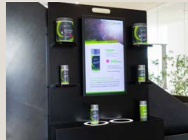
INTERAKTIVER POINT OF SALE

Im Digital Signage-Bereich als auch bei interaktiven Displays werden Lösungen verlangt, die mehr können, als nur eine PowerPoint-Präsentation anzuzeigen. Der Markt passt sich diesen veränderten Anforderungen an, Displays werden immer intelligenter. Wir entwickeln individuelle Lösungen für den Point of Sale.