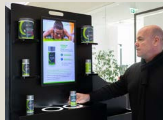
ALLE INFOS AUF EINEN BLICK

Überraschen Sie Ihre Kunden und nützen Sie den „WOW- Effekt“. Animieren Sie Ihre Kunden zum Kauf!