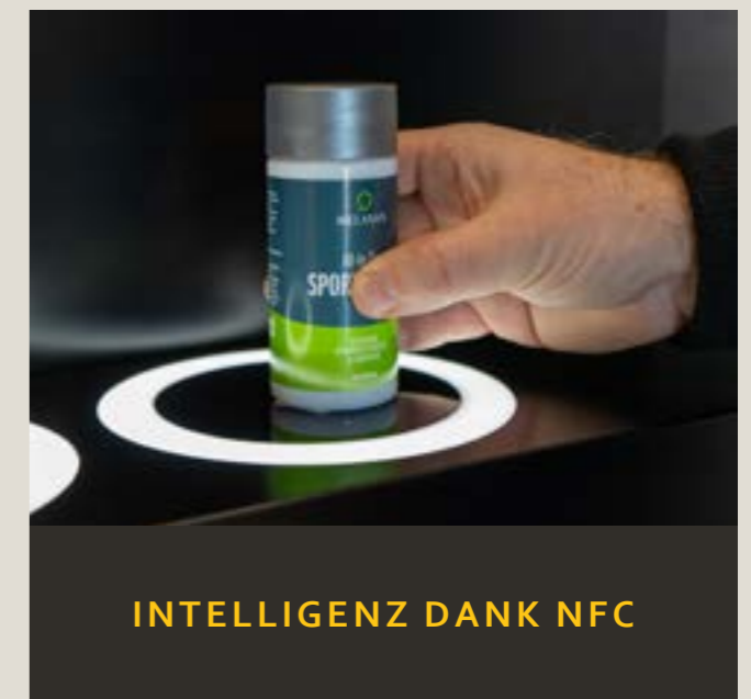
INTELLIGENZ DANK NFC

Der P.O.S. MASTER ist der richtige Mix von Kommunikation, physischer Warenpräsenz und der persönlicher Verkaufsberatung, optimiert durch hochwertige Interaktivität.